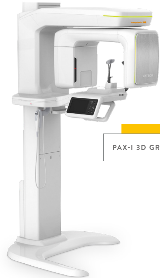
PAX-I 3D GREEN NXT